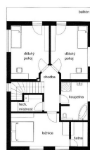
03/04 ČESTMÍR 1:100 STUPEŇ DRUHÝ: FUTUR