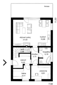
DOM ČESTMÍR STUPEň PRVNÍ FUTUR