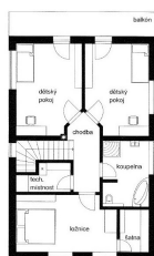
DOM ČESTMÍR STUPEň DRUHÝ FUTUR