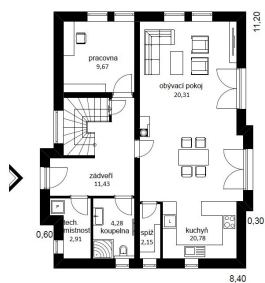
DŮM MICHAELA STUDIE FIRMY FUTUR