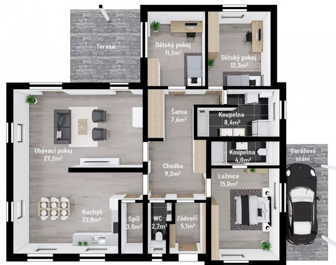
DŮM GABRIELA STUDIE FIRMY FUTUR